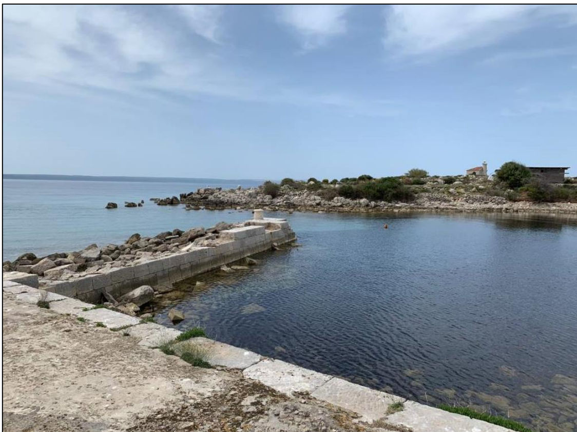
Slika 2. „Portić“, Svibanj 2020 godine

„Portić“ koji je čuvao naše mornare, ribare i težake, bonaca od uvale za vrijeme olujnog mora i vjetra, danas ima drugačiju sliku i ulogu.